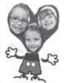
Un bricolage des enfants MS