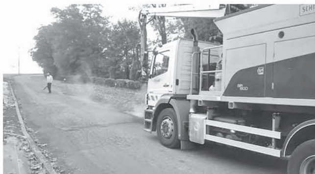
Route de Mons, « l'éléphant » au travail