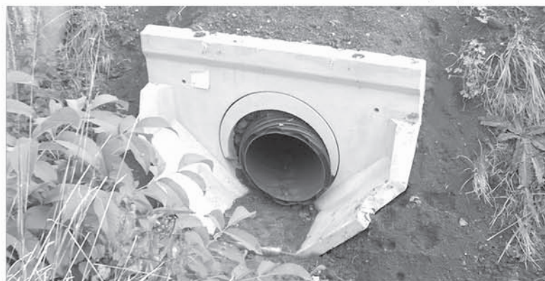
Sortie en 400 du nouveau fossé