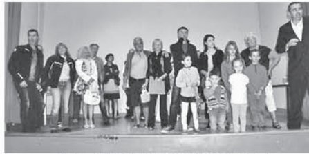
Accueil nouveaux habitants

Risque de colmater le lit d'infiltration