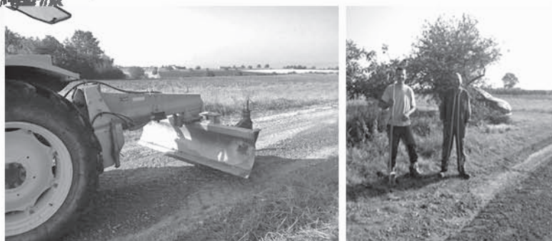
En septembre, essai de maintenance du chemin ferré de la D 2009 à la plate-forme compost, par nos soins