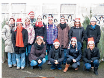
Vente de sapins

Une nouvelle fois, l'Association des Parents de l'École Aubiat/Chazelles a organisé sa traditionnelle vente de sapins de Noël le samedi 6 décembre à l'école d'Aubiat. Parents et quelques habitants de la commune ont bravé le froid pour venir déguster un vin chaud et quelques friandises maisons. Les bénéficiaires ont pour objectif de participer aux financements des divers projets de l'école, à l'achat de matériel scolaire, sportif... et à des spectacles divers et variés.