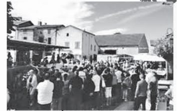
Fête du village