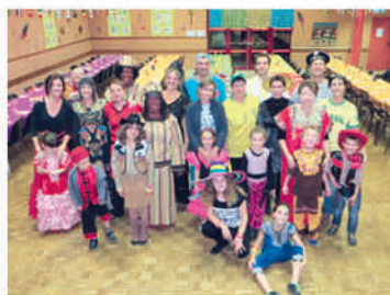
Carnaval de l'école