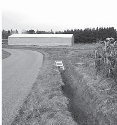
Création d'un fossé