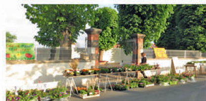
Marché aux fleurs réalisé au printemps

Une nouvelle fois, l'Association des Parents de l'École Aubiat/Chazelles a organisé sa traditionnelle vente de sapins de Noël le samedi 6 décembre à l'école d'Aubiat. Parents et quelques habitants de la commune ont bravé le froid pour venir déguster un vin chaud et quelques friandises maisons. Les bénéficiaires ont pour objectif de participer aux financements des divers projets de l'école, à l'achat de matériel scolaire, sportif... et à des spectacles divers et variés.