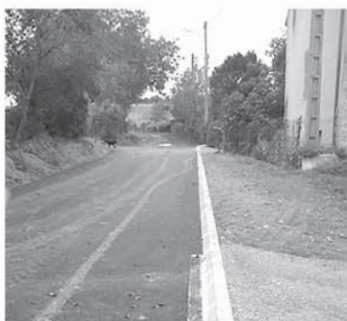
Réseau pluvial à la Raynaude